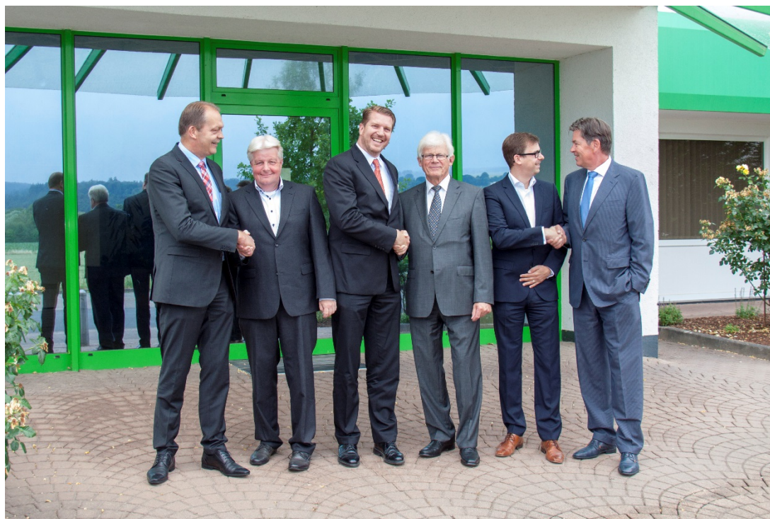
Photo 1 : Lancement de HEGLA-HANIC GmbH en tant que société indépendante du groupe HEGLA.