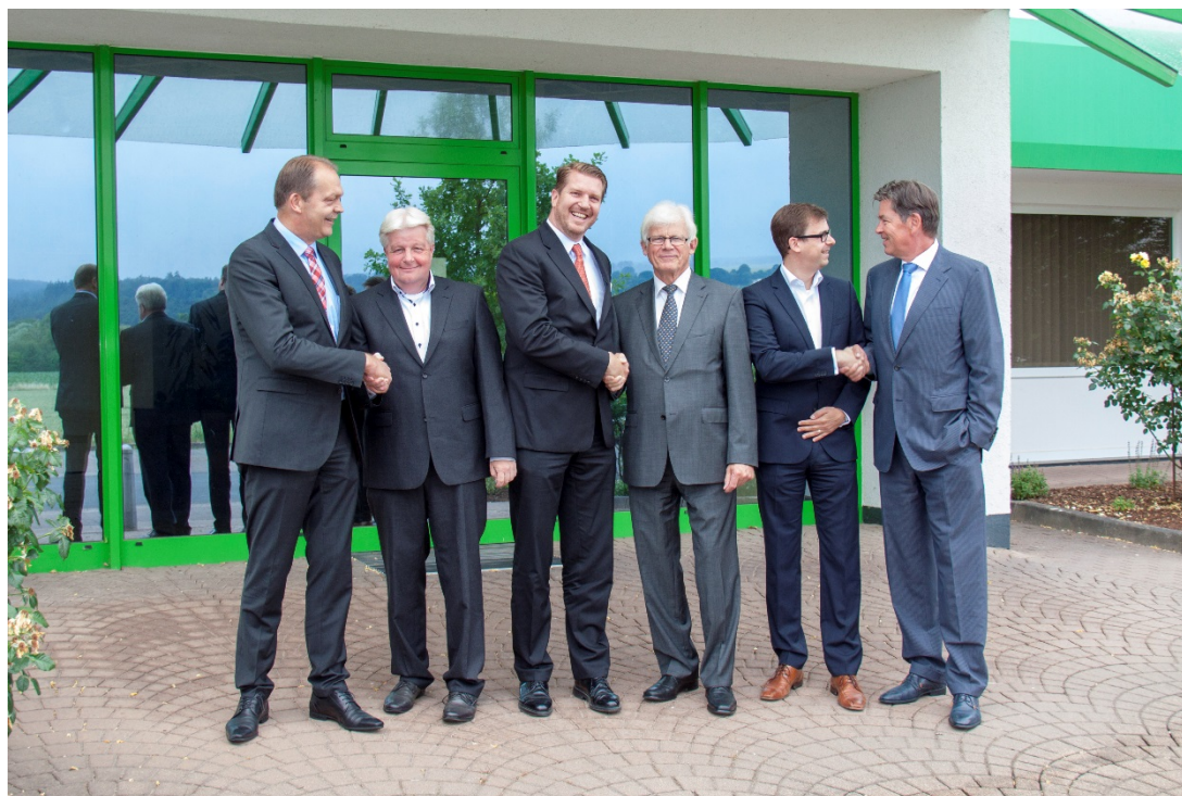
Bild 1: Startschuss der HEGLA-HANIC GmbH als selbstständiges Unternehmen der HEGLA-Gruppe.